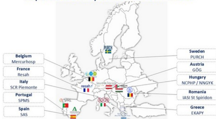
Map of the 10 Country Leaders involved in PROCURE

Se așteaptă ca rezultatele studiului observațional, alături de viitorul instrument statistic digital dezvoltat de UPM, denumit EU Contract Hub, să modeleze aceste inițiative, ajutând sistemele de sănătate din Europa să se pregătească pentru viitor cu o strategie de achiziții puternică și unificată.