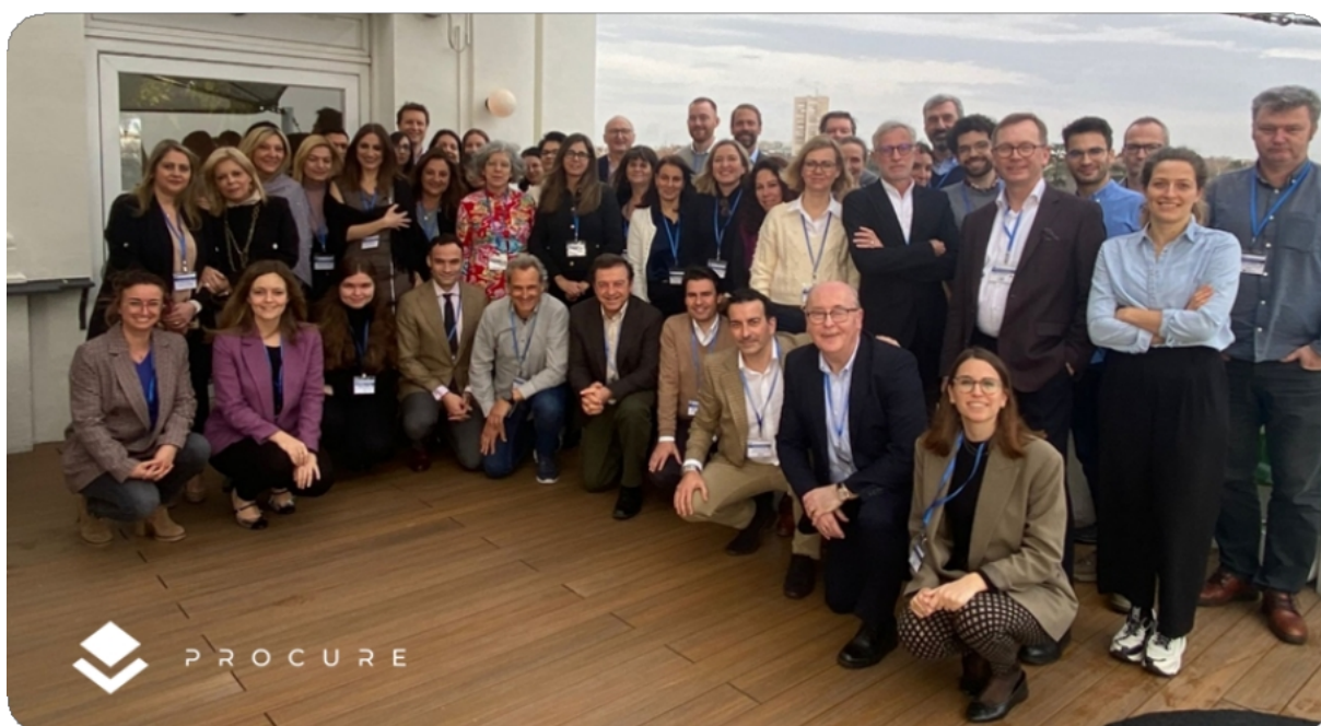
Echipa de achiziții

Ce puteți găsi în acest buletin informativ: