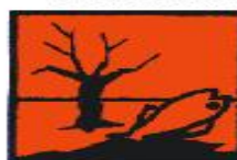
Periculos pentru mediu

Pentru deșeurile infecțioase care nu sunt tăietoare-intepătoare se folosesc cutii din carton prevăzute în interior cu saci din polietilena sau saci din polietilena galbeni ori marcați cu galben. Atât cutiile prevăzute în interior cu saci din polietilena, cât și sacii sunt marcați cu pictograma "Pericol biologic".